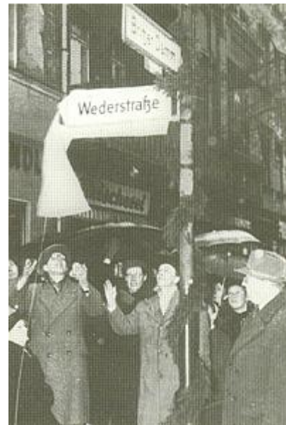
Straßenrückbenennung am 23. Januar 1956

Heute ist das alte Neubritz im Zuge des Autobahnausbaus von Tempelhof nach Schönefeld Sanierungsgebiet und wird einem nachhaltigen Wandel unterzogen. Zentraler Bereich ist nun der Carl-Weder-Park, der auf dem Tunneldeckel der Autobahn entstand. An dem Park werden in Zukunft attraktive Wohnungen entstehen und Gewerbebetriebe an der Ausfahrt Buschkrugallee beste Standortbedingungen vorfinden.